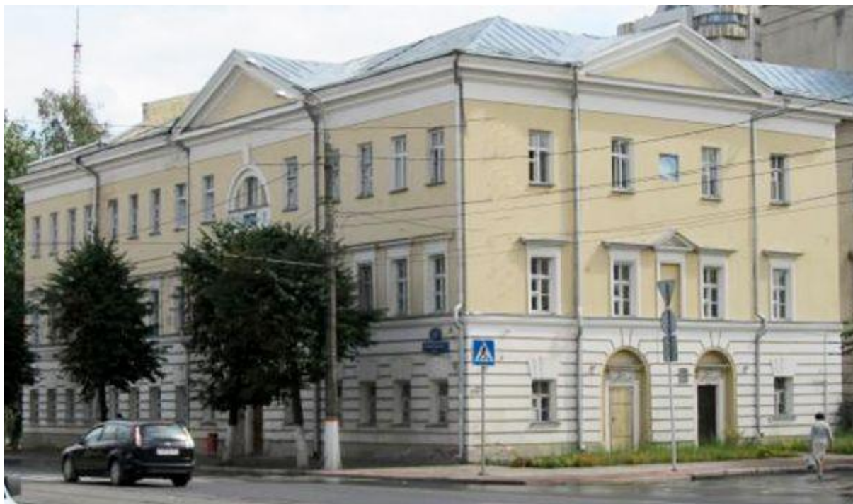
Информационно-библиотечный центр Тверского государственного университета Тверь, улица Советская, 58