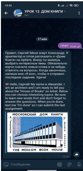
Рис. 1. Стартовое сообщение

Второе задание активируется не по кнопке, а по сообщению студента в чат-бот с формулировкой «Я всё». Это творческое задание из учебника, в котором студенту предлагается написать, что он любит читать и какая книга на русском языке его самая любимая.